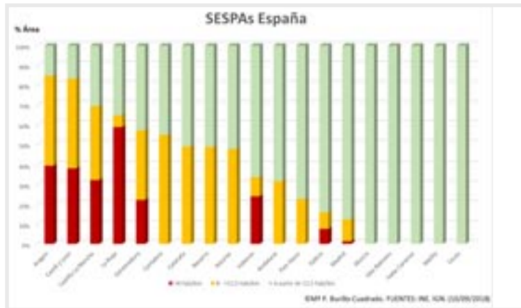
Porcentaje de las Zonas Escasamente Pobladas por Comunidades Autónomas

ce en la existencia de amplias zonas deshabitadas», cuya situación se mide por la densidad de población, como resultado de dividir la población entre la superficie.