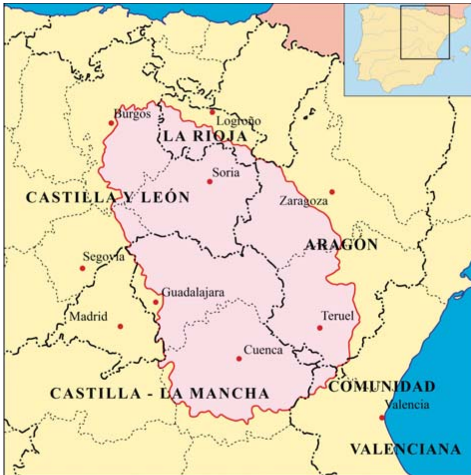
Delimitación del territorio montañoso de la Celtiberia.

densidad de población, elevada significación de la actividad agraria, bajos niveles de renta y un importante aislamiento geográfico o dificultades de vertebración". De hecho, su bajísima densidad demográfica y su absoluta ruralidad, la sitúa en el más alto ranking de las zonas preferenciales de toda España.