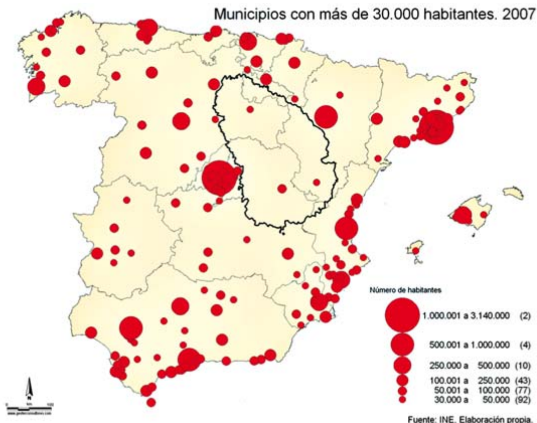
Municipios con más de 30.000 habitantes.