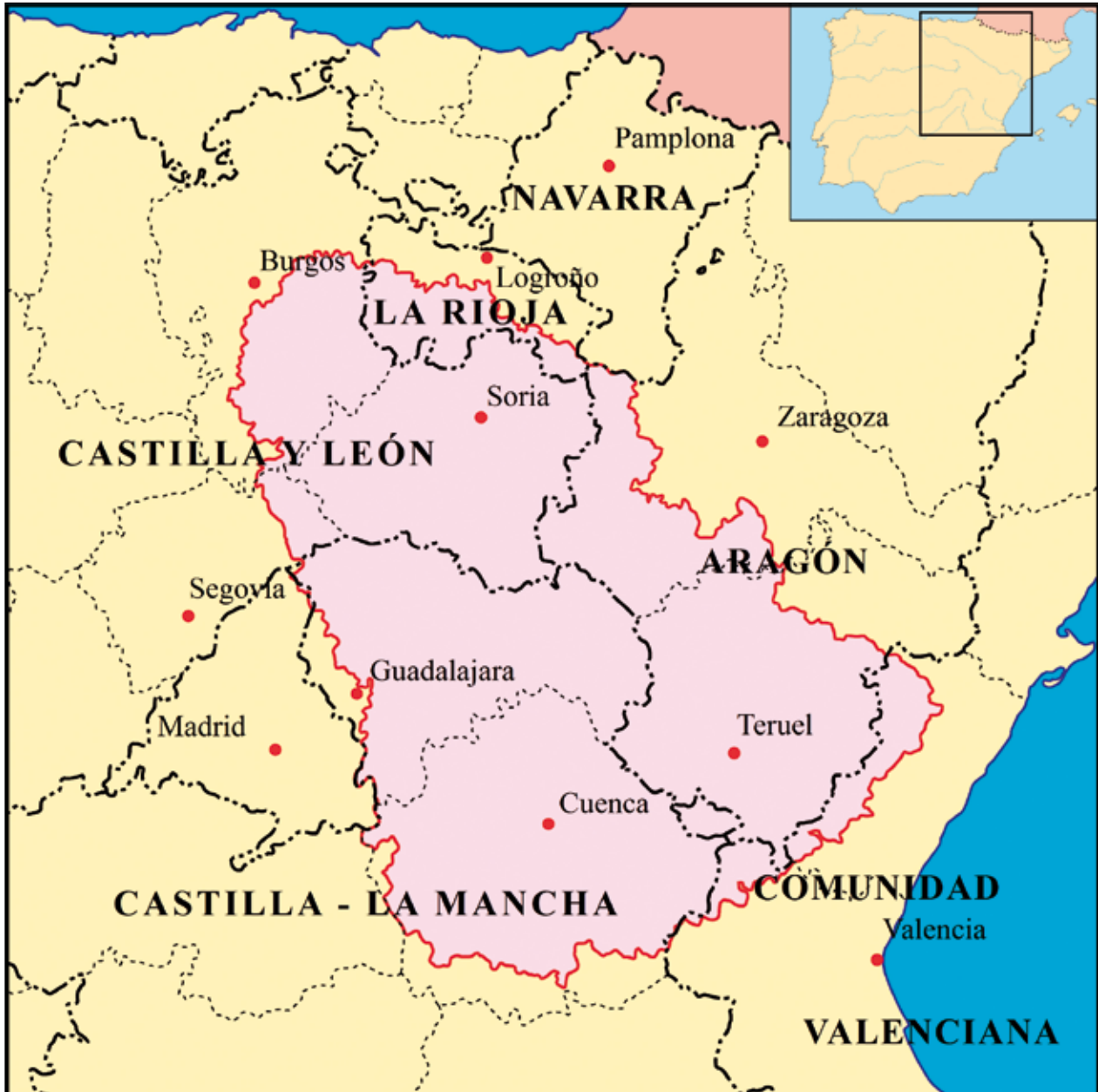
Figura 1. Delimitación de la "Serranía Celtibérica".

más baja de España, sus características de verdadero desierto quedan reflejadas cuando se buscan los paralelos a escala de Europa, ya que sólo se hallan en las regiones árticas de Suecia y Finlandia con densidades de 9,8 en Dalarnas län; 9,6 en Pohjois-Karjala; 4,6 en Västerbottens län o 2 en Lappi. Cifras, estas últimas, extremas en las que se encuentran las zonas rurales más deshabitadas del territorio montañoso de la Celtiberia como la Serranía de Albarracín o la Serranía de Cuenca (figura 3).